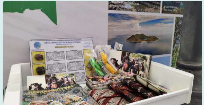
Booth Pameran Indonesia

Jaringan Geopark Indonesia membuka dua booth dalam exhibition yang dilaksanakan dalam rangkaian acara The 10 th International Conference On Geopark of UNESCO. Pameran diikuti oleh seluruh negara peserta konferensi dan beberapa kementerian dari Kerajaan Maroko. Adapun booth Indonesia diisi oleh sembilan Geopark. Salah satunya Geopark Kebumen.