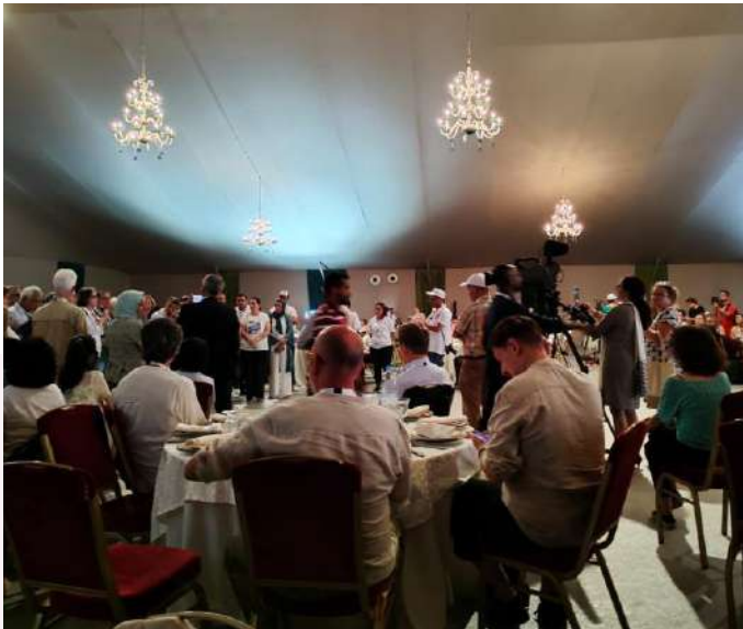
Rapat Darurat Pasca Gempa Bumi Maroko, dilaksanakan di tenda darurat