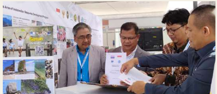
MoU Geopark Kebumen dengan Geopark Langkawi, Malaysia dan Geopark Satun, Thailand