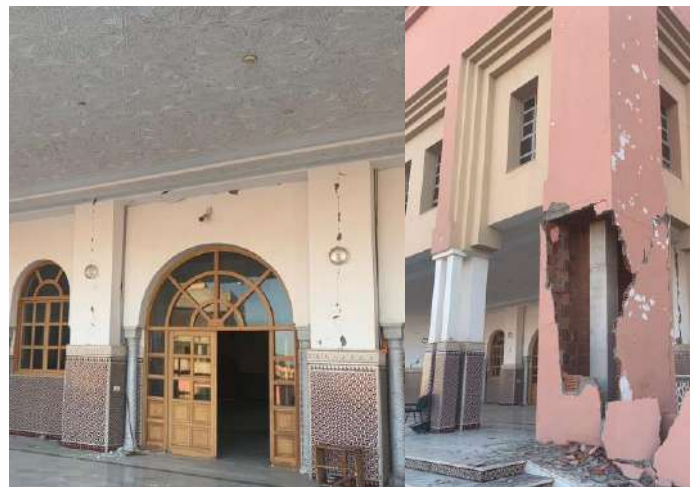
Kondisi Gedung Complexe Culturel et Administratif des Habous Marrakesh Maroko tempat berlangsungnya konferensi.

Menyikapi hal itu dilaksanakan pertemuan darurat di luar ruangan karena bangunan tempat konferensi sebagian dalam keadaan retak dan berbahaya akibat gempa.