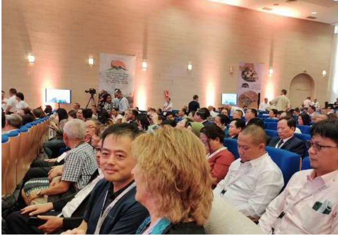
Peserta Opening Ceremony The 10 th International Conference On Geopark of UNESCO

Pada rangkaian acara selanjutnya, dilaksanakan pemaparan dari berbagai negara mengenai pengembangan Geopark, pemberdayaan komunitas lokal dan pembangunan berkelanjutan.